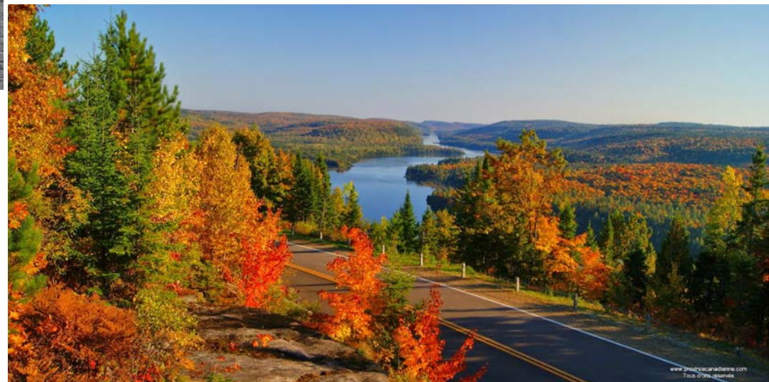
(Parc de la Mauricie)