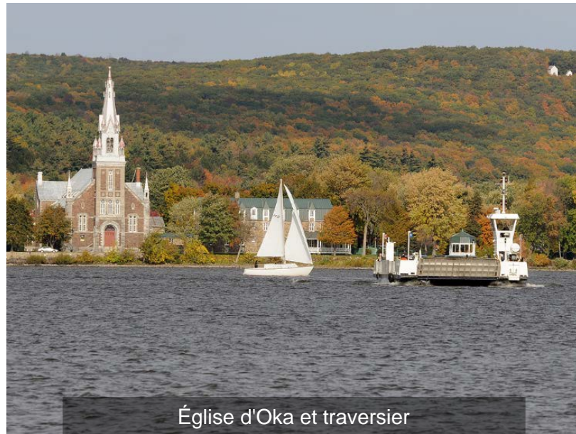
Église d'Oka et traversier