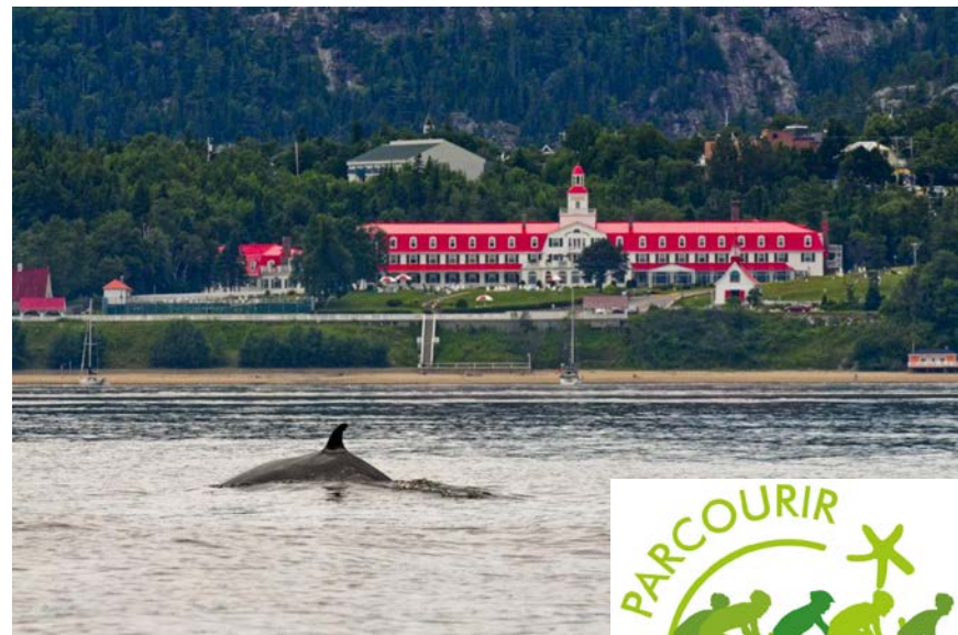
(Hôtel Tadoussac; booking.com)