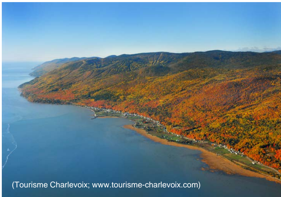
(Tourisme Charlevoix; www.tourisme-charlevoix.com)