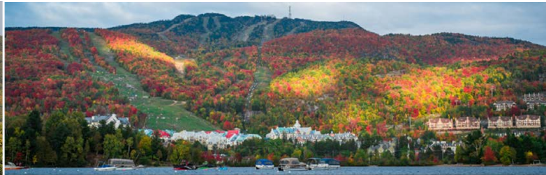
(Mont Tremblant; croisiere-tremblant.com)